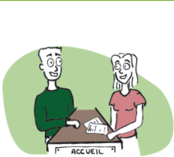
- en me déplaçant