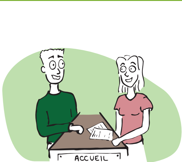
· en me déplaçant