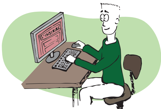
· sur le site internet de la POL