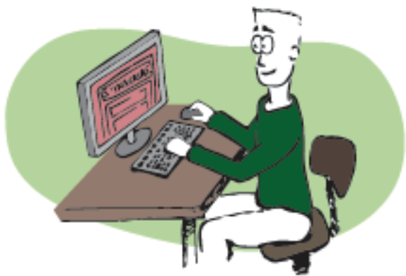
- sur le site internet de La POL