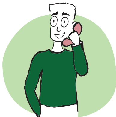
· par téléphone